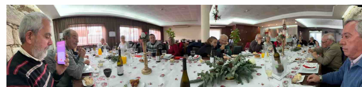
Convívio de Natal SITENORTE