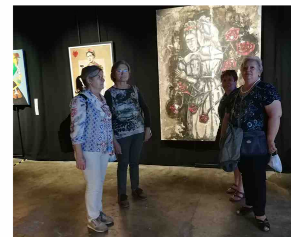
Exposição frida kahlo

Em qualquer idade, o lazer, pois é disso que se trata, é propiciador de um maior grau de autonomia e independência que se reflete na saúde e autoestima. Nos idosos, ainda é mais importante pois evita o isolamento através do convívio com outros na mesma situação, conhecendo outros lugares, fazendo novas amizades e novas aprendizagens; assim, o corpo obtém maior resistência, um melhor equilíbrio e flexibilidade além de manter o cérebro ativo e de reforçar o sistema cardiovascular. O idoso ao permanecer activo conserva a autonomia, melhora a sua autoestima tão necessária para a preservação da saúde, sendo indispensável promover a atividade e a interação social como contributo para um envelhecimento bem sucedido.